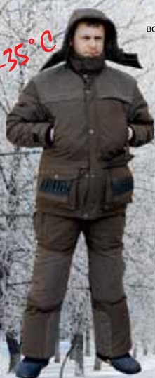
арт. 9877 Сарыч

ХСН - пожалуй ЛУЧШЕЕ, что может быть в одежде!!!