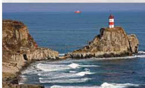
Приморье – край, открытый миру!