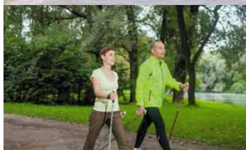
Палки в руки! Шагом марш!