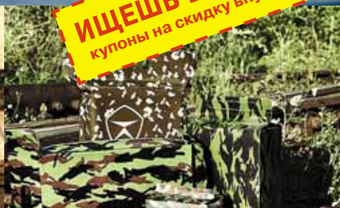
Еда для настоящих мужчин... и не только!

ИЩЕШЬ ВЫГОДУ? купоны на скидку внутри!!!