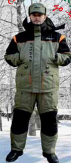
арт. 9880 Arctic