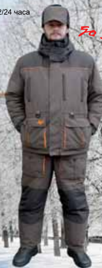
арт. 9881 North Fish