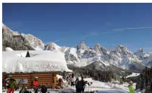
Кронплац – парадный склон Италии